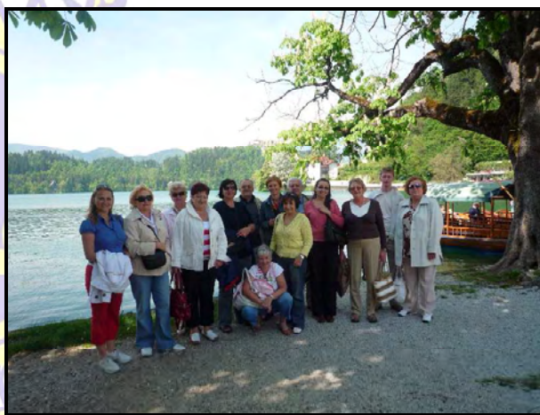
lionští účastníci zájezdu do Slovinska a Benátek

nádherné a je tam vše – hory, vodopády, moře, města, vesničky a hlavně báječní lidé. Lublan, Terst, Miramare, Benátky, výborná slovinská a italská jídla a vína. Užívali jsme si.