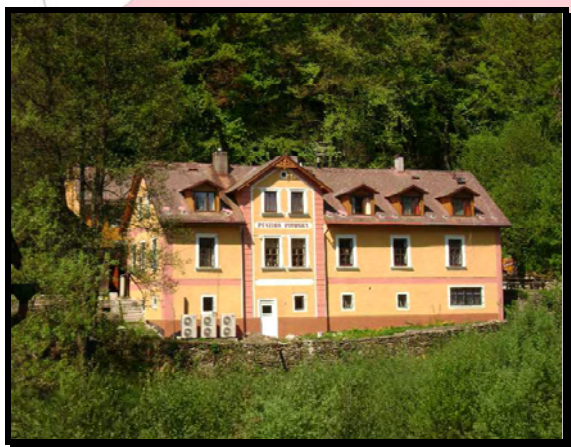
Penzion Pivoňka- cíl výletu s krásným okolím