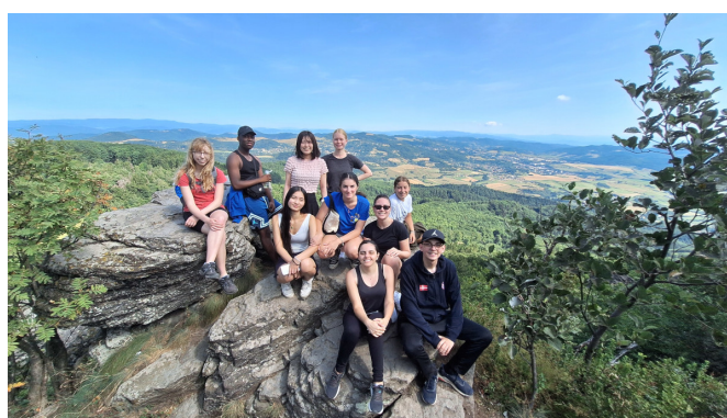
Odmenu za námahu výstupu bol výhľad zo Sitna

Nasledujúce 3 noci sme strávili v krásnom prostredí Štiavnických vrchov, priamo pri jazere Počúvadlo. Tu sa nám o program a ubytovanie starali Lioni z LC Banská Štiavnica. Nechýbal výstup na Sitno a večerné opekanie špekačiek pri ohni, tentokrát sponzorované LC Lea. Chlapci vyrábali ražne, rúbali drevo, rozkladali oheň, dievčatá chystali pochutiny k ohňu – pre nás veci bežné a zrejme, ale pre zahraničných mládežníkov to bolo rozširovanie obzorov o veci dovtedy nepoznané. Keďže sme boli neďaleko jazera, polnočné plávanie v Počúvadle sme nemohli vynechať z nášho programu. Prehliadka mesta Banská Štiavnica začala v expozícii banského múzea, mladí baníci dostali prilby, pláštenky, lampáše a na chvíľu si vyskúšali pocity baníkov, ktorí stvorili banské mestá stredného Slovenska.