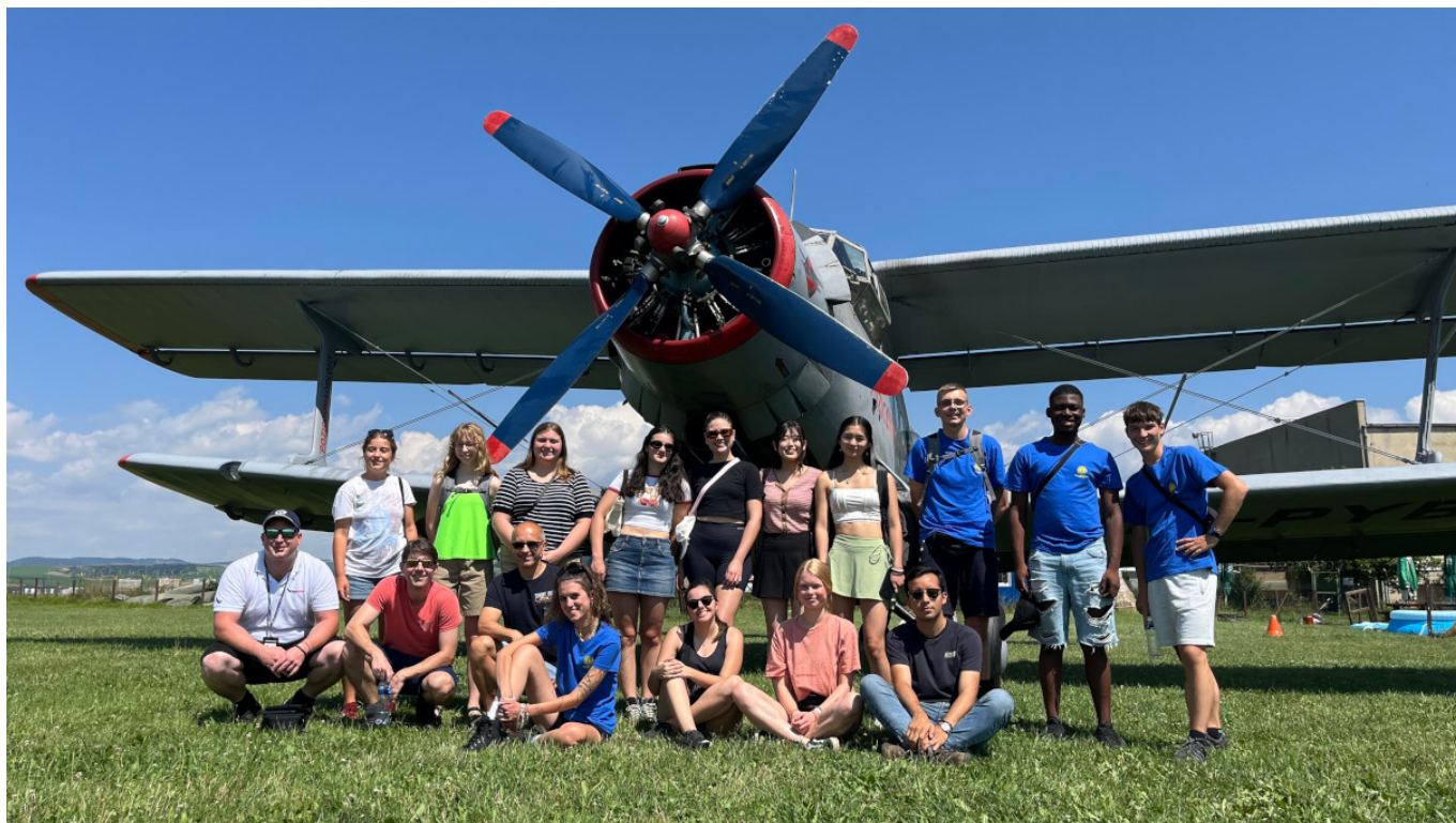
Pózovanie pred odchodom

Ako každý rok, aj v roku 2024 sme v rámci programu Výmena mládeže sprostredkovali pobyt v zahraničí mládežníkom z D122, ktorí mali možnosť navštíviť krajiny na všetkých osídlených kontinentoch. Unikátnu možnosť vycestovať, zažiť a vidieť niečo nové využilo 38 mládežníkov zo 16 klubov nášho distriktu. Mladí ľudia z Čiech a Slovenska spoznávali krajiny ako Austrália, Japonsko, Čína, Brazília, Mexiko, USA, Kanadu alebo krajiny EÚ. Všetci sa vrátili s novými zážitkami, vedomosťami i priateľstvami.