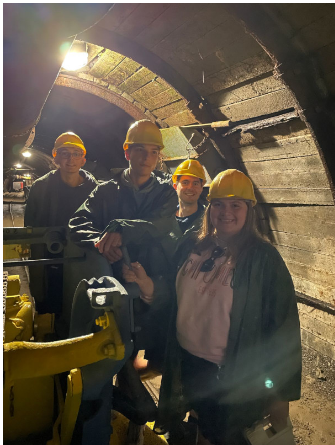
Hluboko v podzemí banského múzea

Záverečnou lokalitou nášho kempu bola malebná dedinka Modra neďaleko Bratislavy. Za krásne ubytovanie a bohatý program vďačíme hlavne klubom LC Pezinok a LC Piešťany. Navštívili sme jaskyňu Driny, zámok Smolenice aj mesto Pezinok. Vo vinárskej oblasti nemohla chýbať návšteva vínneho sklepa v zámku Šimák spojená s riadenou ochutnávkou miestnych vín. Výlet do Bratislavy začal na vode – previezli sme sa člmi po ramene aj hlavnom toku Dunaja. Prehliadka Bratislavy so sprievodcom predstavila tie najatraktívnejšie časti mesta.