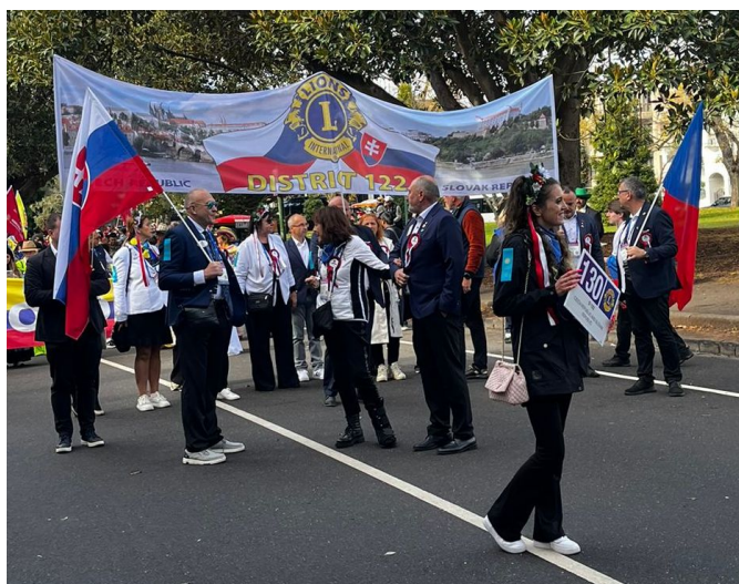
D122 vyráží na pochod

Při návštěvě Melbourne Convention and Exhibition Centre a neformálních setkání jsme cítili energii a nadšení účastníků, kteří byli doslova nabiti elánem při možnosti setkání s kolegy z různých částí světa. Pro mnoho Lions byla konference jedinečnou příležitostí sdílet své úspěchy, jakož i výzvy, se kterými se setkávají ve svých komunitách. Otevřenost a přátelská atmosféra vedly k mnoha inspirativním diskuzím a výměnám nápadů. Tyto interakce nám poskytly nejen širší pohled na problémy, které jsou řešeny různými způsoby, ale také nové úhly pohledu, jak tyto problémy lze efektivně řešit. Pro všechny Lions z D122 České republiky a Slovenské republiky byla World Convention velmi přínosná. Navázali jsem další mezinárodní kontakty, které mají dobrý potenciál rozvinout se do nových projektů a spolupráce posílit všechny naše projekty současné.