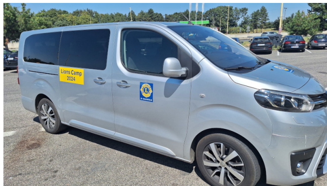
Autá s nálepkami Lions Camp 2024 brázdia Slovensko