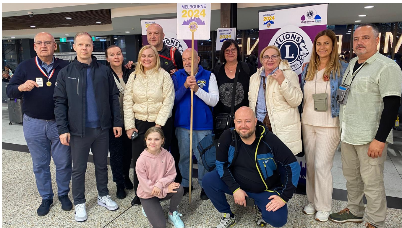
Výprava D122 po přeletu

World Convention 2024 Lions Clubs International v Melbourne byl pro nás všechny Lions a náš nejbližší doprovod, kteří se této významné akce zúčastnili, zcela jedinečnou příležitostí absolvovat cestu nejen na nejvýznamnější každoroční událost Lions Clubs International, ale cestu tam a přitom na opačnou stranu zeměkoule, do Austrálie.