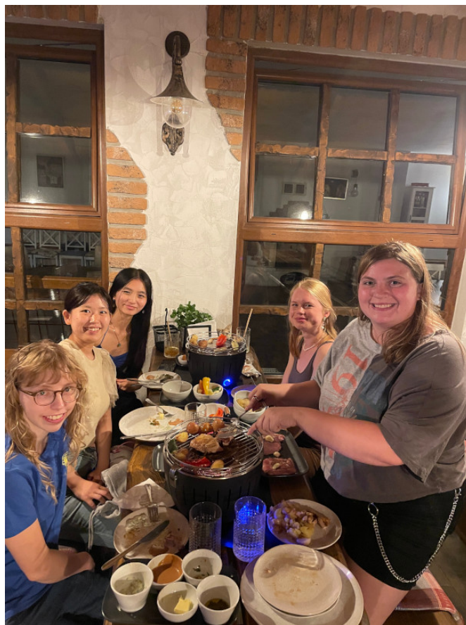
Jedlo spája ľudí

Tento rok sa kemp organizoval na Slovensku. Bol to putovný kemp, ktorý nás previedol Slovenskom od východu na západ. Na organizácii kempu sa podieľali skoro všetky Lions kluby zo Slovenska, každý prispel ako mohol – či už sponzorstvom stravy, zabezpečením programu alebo pomocou s ubytovaním. Patrí im veľká vďaka, za to, že sa opäť podarilo pripraviť podujatie, ktoré s úspechom reprezentovalo našu krajinu a jej Lionov.