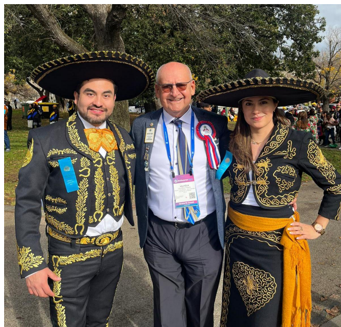
Spřátelili jsme se s liony z Mexika

Návrat přes Kuala Lumpur, Istanbul a Singapore byl sice jen tranzitem na letištích, ale i tak jsme měli možnost ochutnat různé národní kultury. Bylo nám líto, že setkání s DG D122 bylo omezené, ale i tak jsme si užili úžasnou společnost našich přátel a kolegů z celého světa.