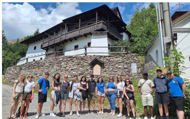
Špania Dolina - exkurzia do starých čias

začali byť trochu podozrievaví, keď počuli z úst vedúcich slovo „ľahká túra“. Nemali však na výber, sme predsa outdoorový kemp. . .