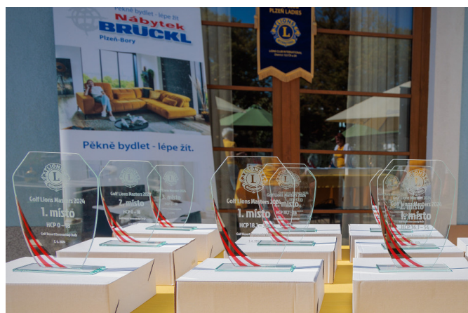
Ceny pro vítěze

způsobily především dříve plánované akce a dovolené hráčů.