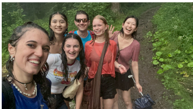
Aj v daždi môže byť dobrá nálada

Výstup rebríkmi Slovenského raja preveril výdrž a odvahu účastníkov – pre niekoľkých to bola prvá turistika v živote. Podvečerná búrka v roklinách iba podčiarkla deň plný adrenalínu.