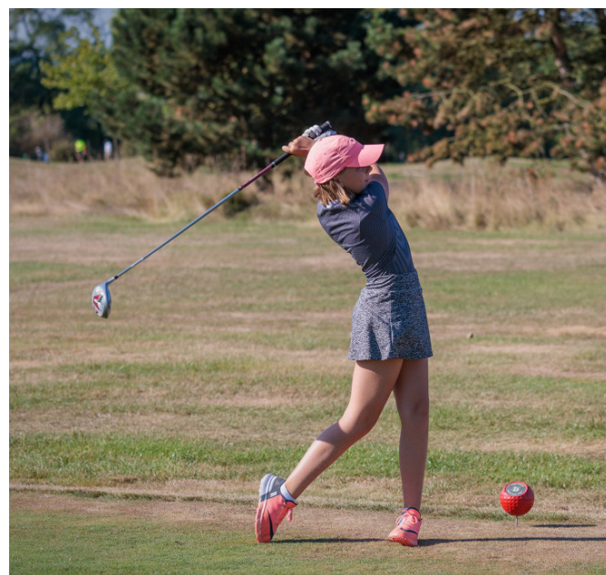
Účastnili se i ti nejmladší

Na startu bylo tentokrát 38 hráčů ze 6 golfových klubů. Největší zastoupení měl Greensgate Golf Club a Golf Club Darovanský dvůr. Celkovou nižší účast