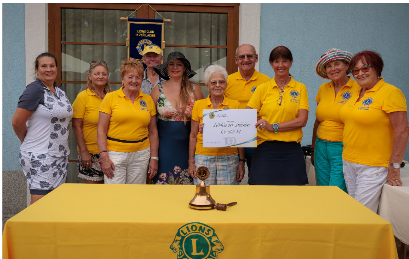
Na turnaji se vybralo 64 900,-

6. ročník dobročinného golfového turnaje LC Plzeň Ladies