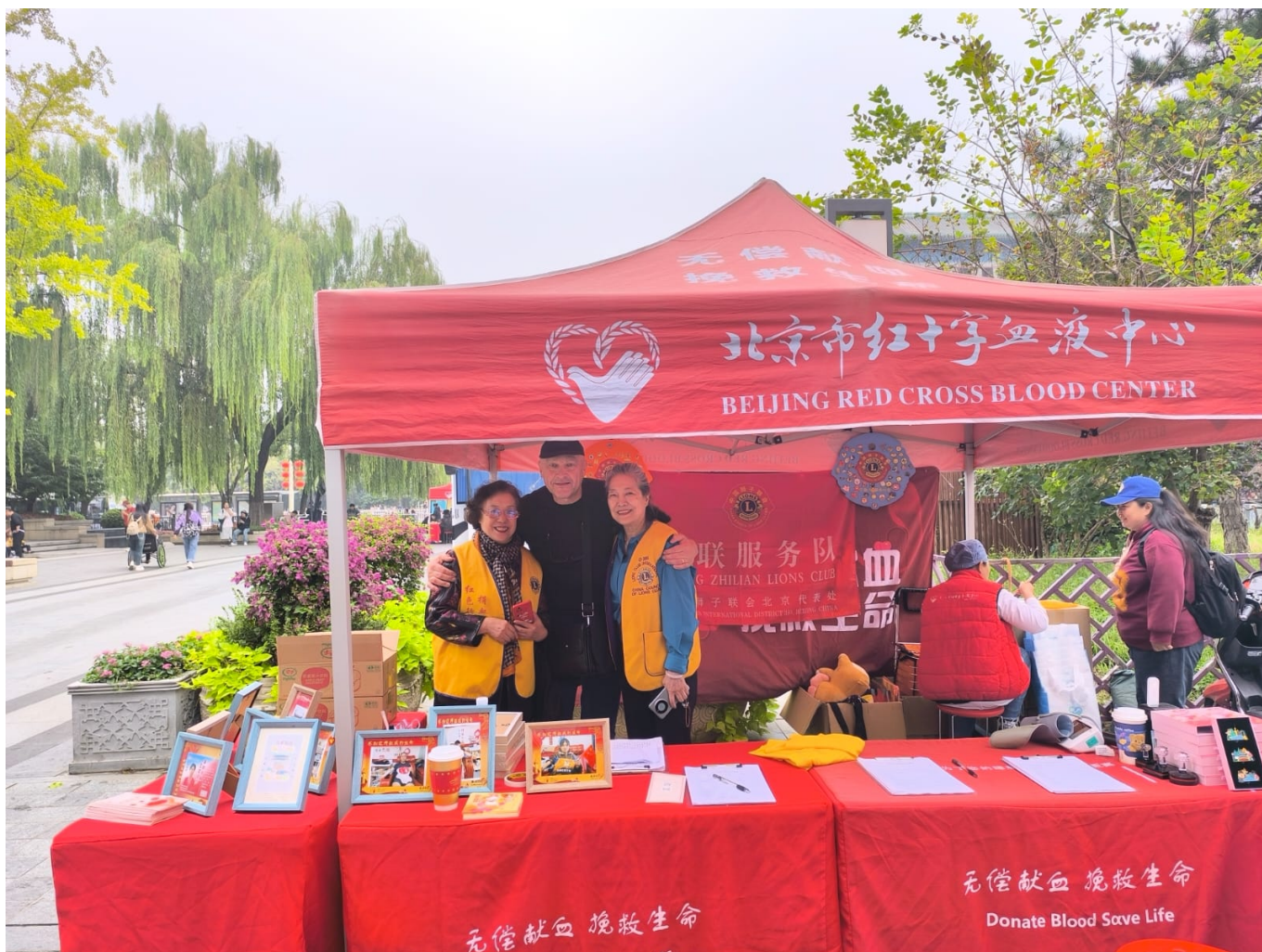
Lioni jsou i číně a starají se o dárcovství krve