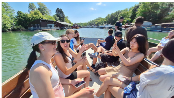
VIP Prehliadka hausbotov na Dunaji

Záverečnou lokalitou nášho kempu bola malebná dedinka Modra neďaleko Bratislavy. Za krásne ubytovanie a bohatý program vďačíme hlavne klubom LC Pezinok a LC Piešťany. Navštívili sme jaskyňu Driny, zámok Smolenice aj mesto Pezinok. Vo vinárskej oblasti nemohla chýbať návšteva vínneho sklepa v zámku Šimák spojená s riadenou ochutnávkou miestnych vín. Výlet do Bratislavy začal na vode – previezli sme sa člmi po ramene aj hlavnom toku Dunaja. Prehliadka Bratislavy so sprievodcom predstavila tie najatraktívnejšie časti mesta.